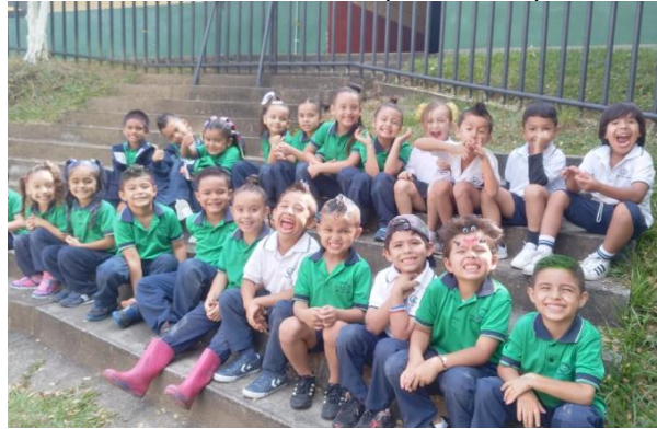
K5 B Track A: Crazy hair day