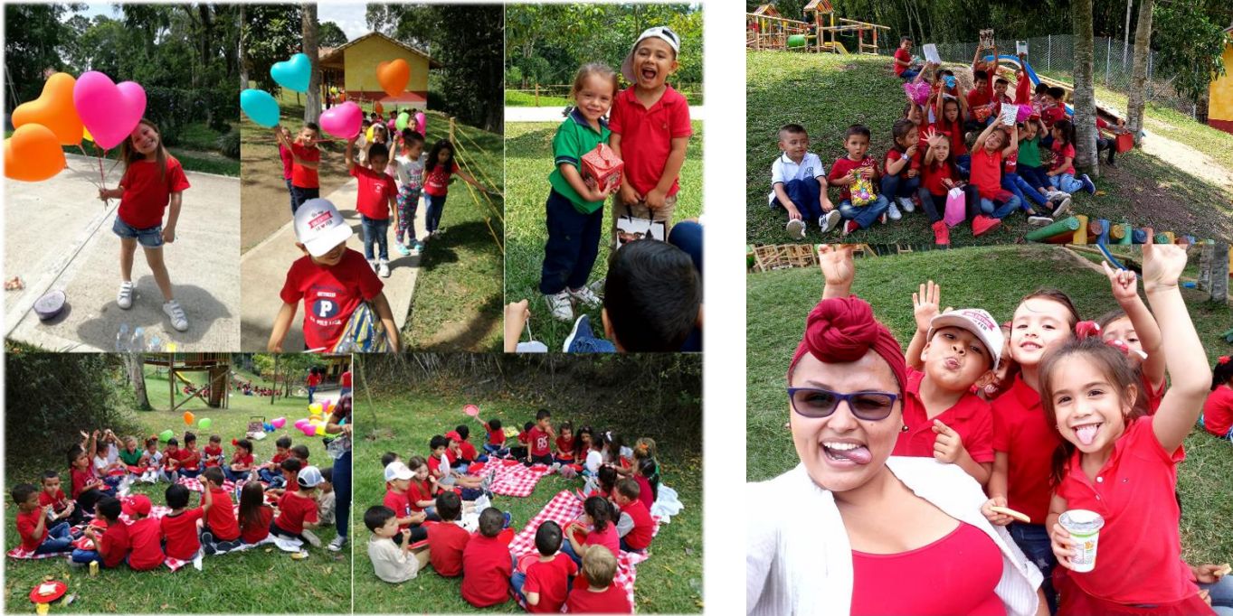
“Celebración Saint Valentine's day.”

Vocabulario: Tomato - train - toys - tree- turtle - ball - bus - baby - balloon - van - vegetables - violin - volcano.