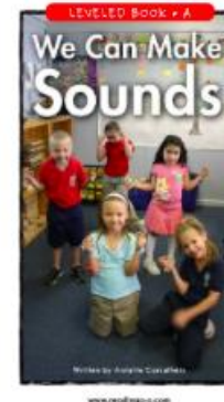
3. We can Make sounds